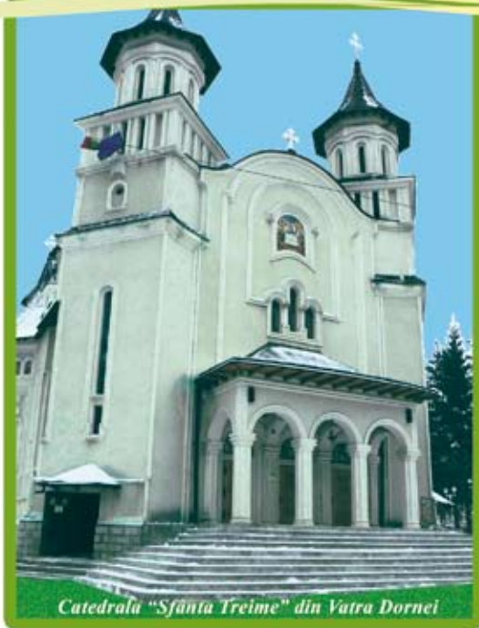
Catedrala "Sfânta Treime" din Vatra Dornei

Deși "păcatele noastre îl împiedică pe Dumnezeu să strălucească în lăuntrul nostru" totuși în conceptul